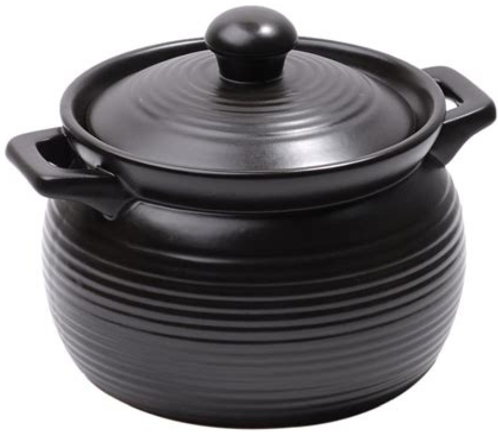
Terraria clay pot